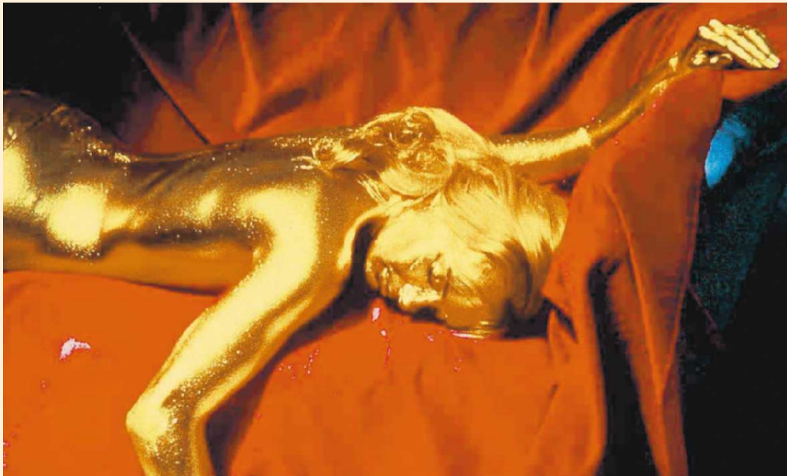
Goldener Overkill: Für das Bond-Girl im Film „Goldfinger“ bedeutet das Edelmetall den Tod, für Privatanleger ein Risiko

Seiner Meinung nach werden die Rohstoffpreise durch den Nutzen begrenzt, den sie für jene haben, die sie benötigen. „Im Fall von Benzin zum